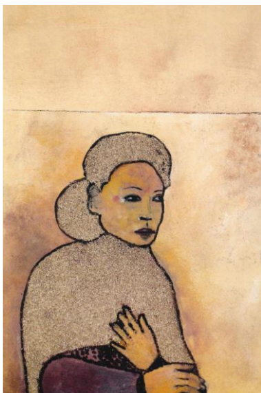
Dorée // 2014

La galerie est ouverte du mardi au samedi de 14h00 à 18h30 également vendredi de 10h à 12h Rendez-vous possible le matin + le lundi au 06 71 633 633